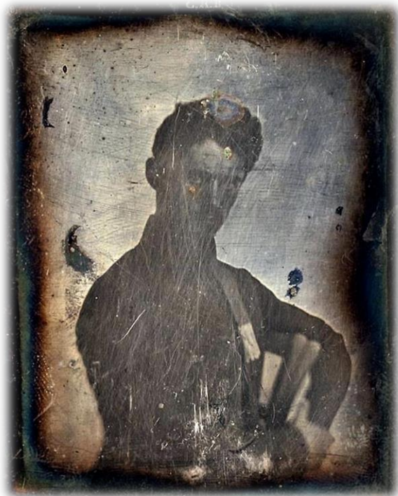
Egressy Gábor (?): Petőfi Sándor (dagerrotopia, 1844 v. 1845)