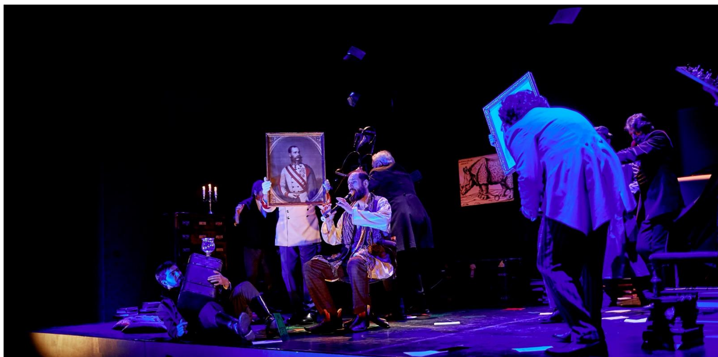
Látomáskép az előadásból

Széchenyi nem álmodott az 1848-as forradalomról, hiszen az maga az erőszak. A forradalom pedig, amely csupa cselekvés, távol áll a békés reformoktól. Széchenyi úgy akarja megváltoztatni a társadalmat, hogy közben elutasítja az erőszakot. Új morált szeretne az emberek tudatába beültetni a felvilágosodáson, a reformokon, a fejlődésen keresztül. Nem pusztán reformpolitikus és államférfi volt, hanem etikai forradalmár, valamint társadalomszervező. A közjóért való munkálkodásról Széchenyi azt tartja, a változást csak akkor lehet elérni, ha megváltozik a közgondolkodás. Ez szerinte úgy változtatható meg, ha tanulnak, nevelődnek az emberek a felvilágosodás eszméin keresztül. A társadalom analízisjeként pedig rájön arra, a modernizációba vetett hit adhatja csak egy feudalizmusba ragadt nép számára a kilábalási, továbblépési lehetőséget a jólét, felemelkedés felé. Így tud az ember gondolkodása nemesebb érdek és érték felé fordulni.