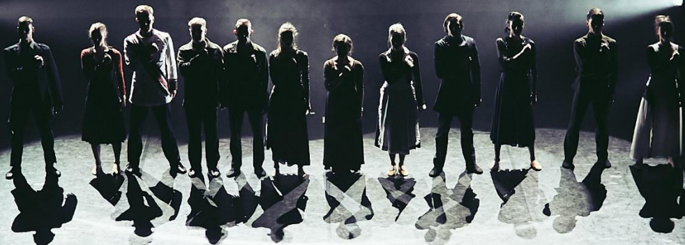
A Sopron Balett előadása

Táncmű a soproni népszavazás 100. évfordulójára